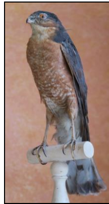
Oiseau rapace du cabinet de sciences naturelles du Collège d'Issoudun.

Tous les objets exposés proviennent des collections du lycée et du collège, mais aussi de La Rabouilleuse et de collections particulières.