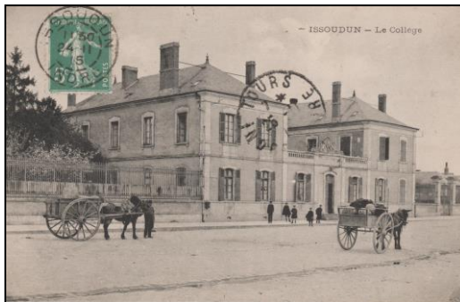
Le collège communal d'Issoudun, vers 1910

Président de l'Amicale des anciens élèves