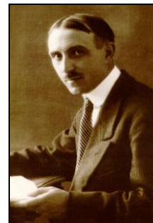
Photo datant de 1921